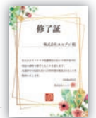
講習終了後に修了証をお渡しします

各業種に合わせて作成した当社制作のマニュアルを使用し、分かりやすくご説明します。なお、マニュアルはご提供いたしますのでぜひご活用ください。